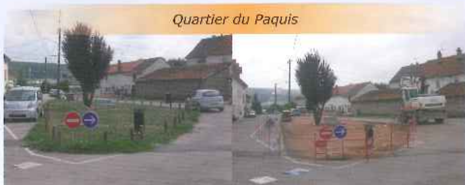
Quartier du Paquis