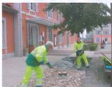
Nouveau parking à la gare