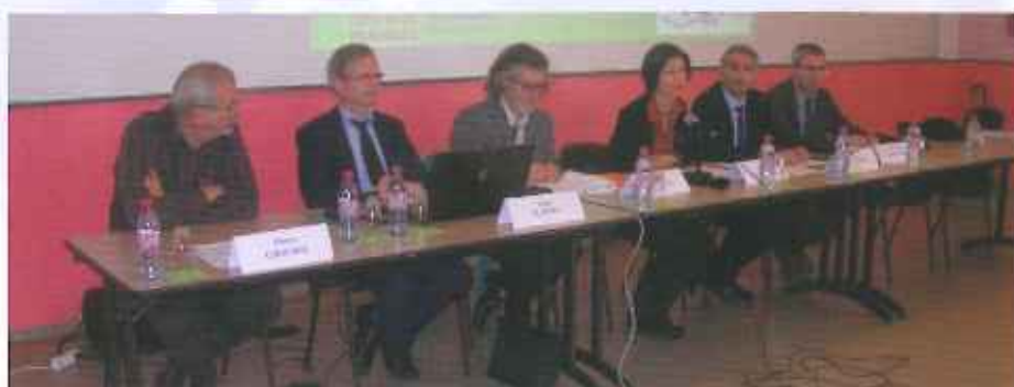
Sécurité routière avec l'ETAT