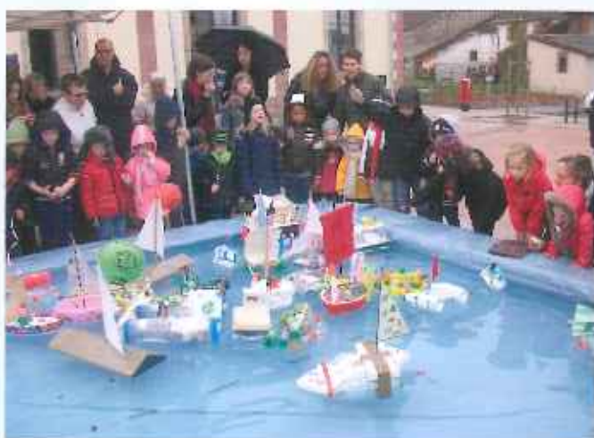
Les Champs golots