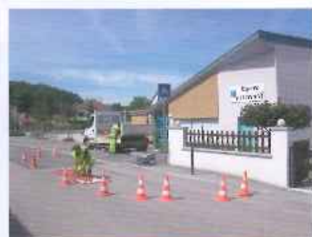
Pour mieux ralentir