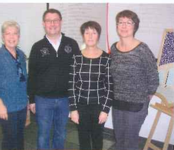
Les Agents du recensement