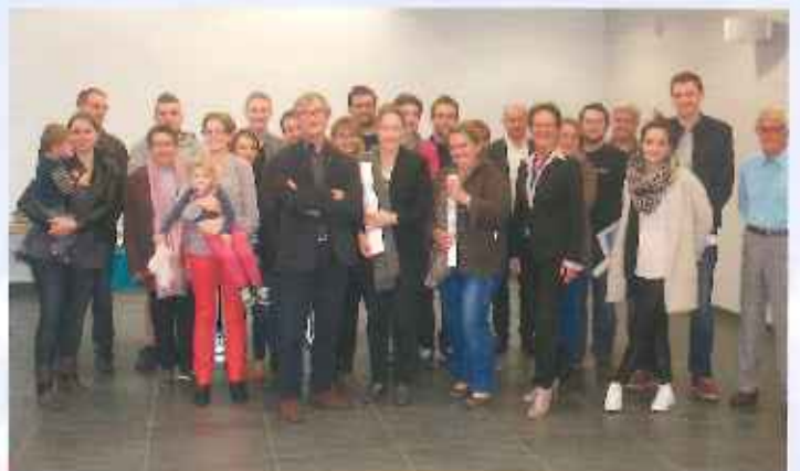
Accueil des nouveaux habitants.