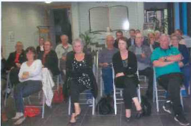
Avec les riverains du Grand Clos.