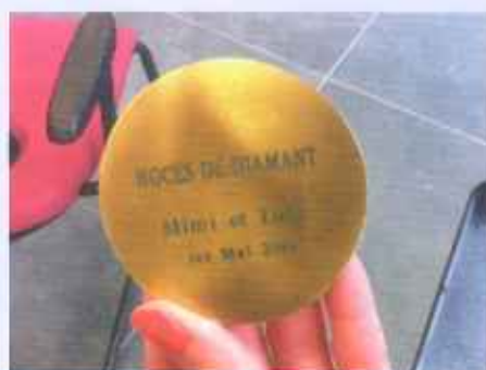
Noces de diamant