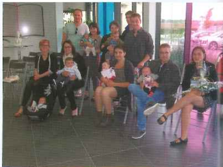
Accueil des nouveau-nés

Fédération Française de Foot : 10 000 € (vestiaires).