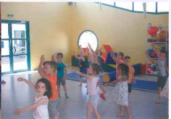
Dans les NAP.