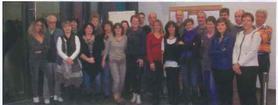
Elus et agents ensemble.