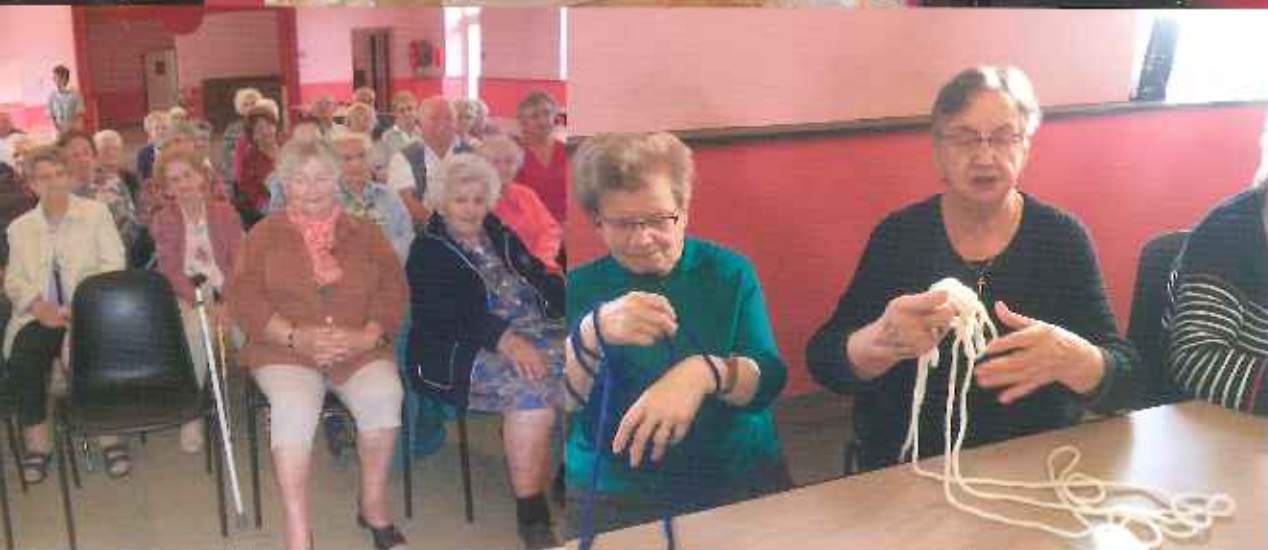
Les jeudis récréatifs