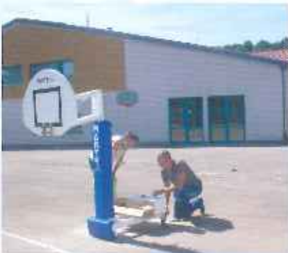
Du basket pour les écoles.